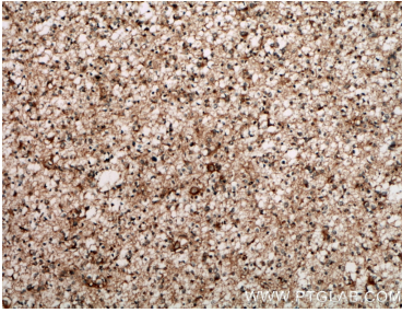
Immunohistochemical analysis of paraffin-embedded human gliomas tissue slide using 12953-1-AP (CA10 antibody) at dilution of 1:200 (under 10x lens. Heat mediated antigen retrieval with Tris-EDTA buffer (pH 9.0).