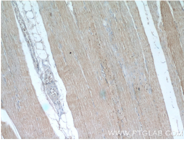
Immunohistochemical analysis of paraffin-embedded human skeletal muscle tissue slide using 55281-1-AP (OBSCN Antibody) at dilution of 1:50 (under 10x lens).