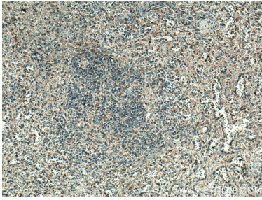
Immunohistochemical analysis of paraffin-embedded human spleen tissue slide using 15739-1-AP (MASTL antibody) at dilution of 1:200 (under 10x lens). Heat mediated antigen retrieval with Tris-EDTA buffer (pH 9.0).