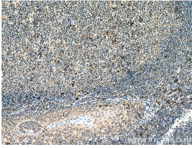
Immunohistochemical analysis of paraffin-embedded human tonsillitis tissue slide using 28455-1-AP (IL15 antibody) at dilution of 1:200 (under 10x lens). Heat mediated antigen retrieval with Tris-EDTA buffer (pH 9.0).