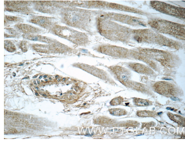
Immunohistochemical analysis of paraffin-embedded human heart tissue slide using 55137-1-AP (LTB4R Antibody) at dilution of 1:50 (under 40x lens).