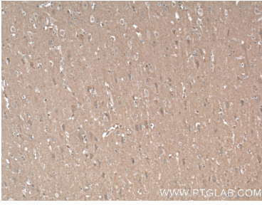
Immunohistochemical analysis of paraffin-embedded human brain tissue slide using 55447-1-AP (AHS2 Antibody) at dilution of 1:200 (under 10x lens). Heat mediated antigen retrieval with Tris-EDTA buffer (pH 9.0).