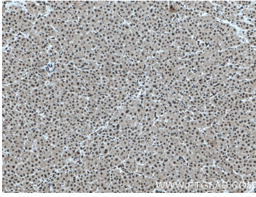
Immunohistochemical analysis of paraffin-embedded human liver cancer tissue slide using 66716-1-Ig (RBX1 antibody) at dilution of 1:5000 (under 10x lens) Heat mediated antigen retrieved with Sodium Citrate buffer (pH 6.0).